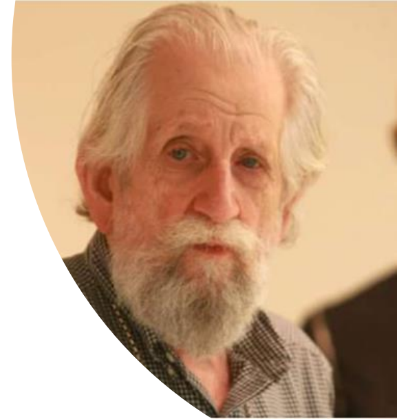
Retrato de Nelson Leirner

Nelson Leirner (1932-) é um artista conceitual. Ele cria com os materiais mais inusitados do cotidiano, monta instalações e apropria-se de imagens de outros artistas, fazendo nelas interferências com colagens e adesivos. Na obra Monas , o artista utiliza um quadro clássico “ Monalisa ” de Leonardo da Vinci e faz diversas intervenções. Uma das ideias do artista é questionar os clássicos da Arte.