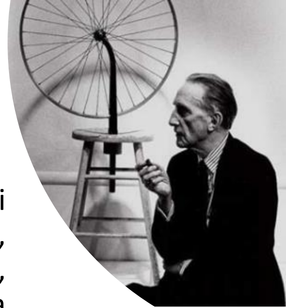
Retrato de Marcel Duchamp

Um dos precursores da arte conceitual foi o artista Marcel Duchamp. Em 1913, Duchamp decidiu colocar em seu ateliê, em Paris, uma roda de bicicleta fixada sobre um banco de madeira.