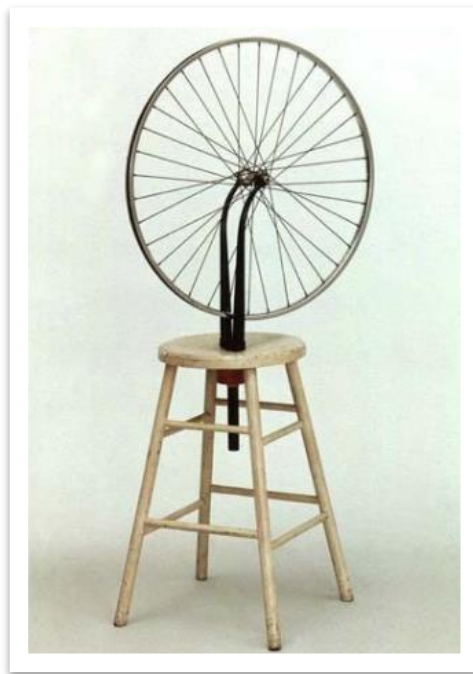
Roda de bicicleta é o primeiro ready made da história da arte, feito em 1913 por Duchamp.